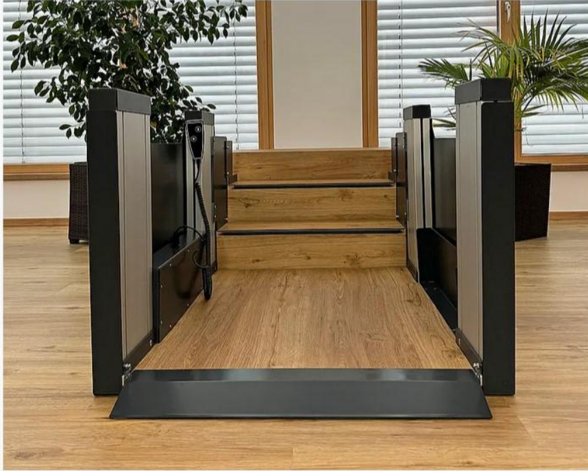
Integrierte Auffahrrampe mit niedriger Einstiegshöhe