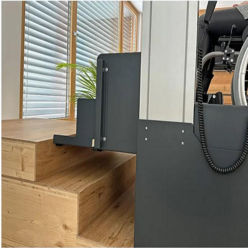
Bestellbar ohne oder mit bis zu zwei Überbrückungsstufe/n