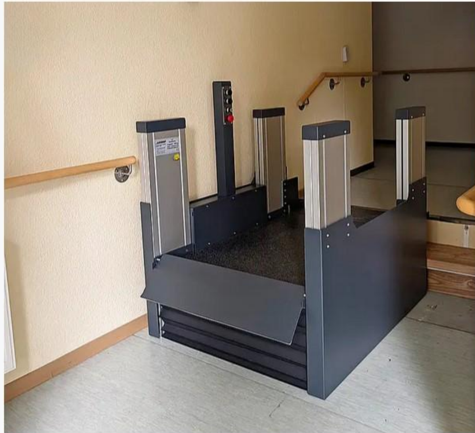
Anlage mit Bediensäule