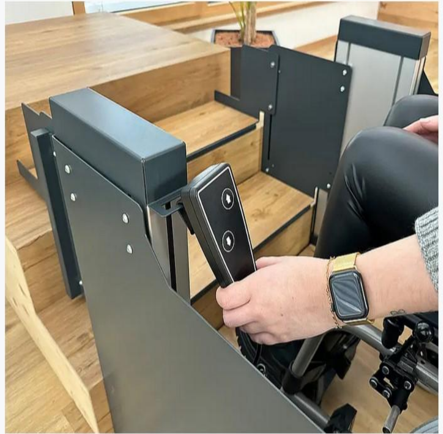
Praktische Aufhängung für Handkassette