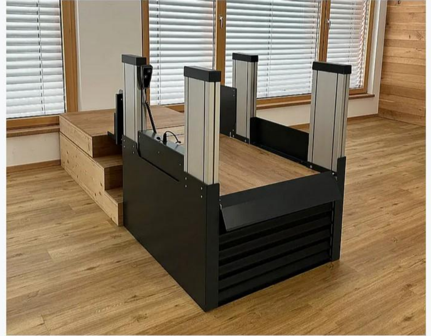
Rampe als Abrollschutz für sichere Nutzung