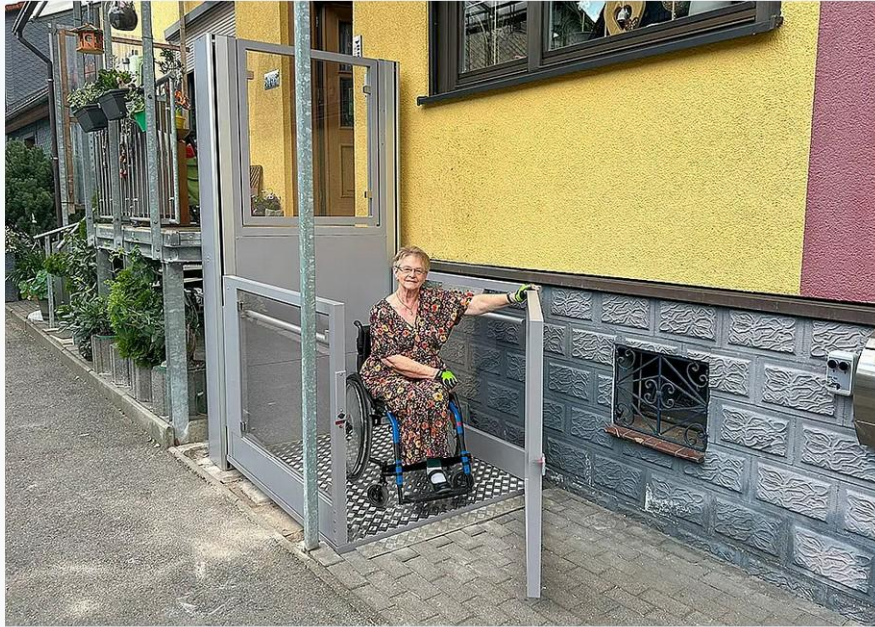
Nutzerin in der unteren Haltestelle