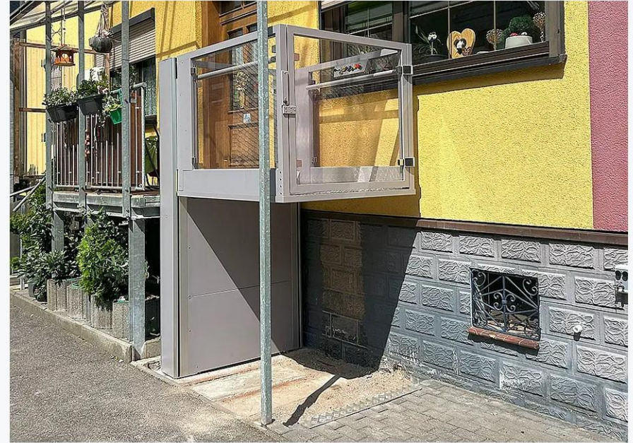
Außenanlage mit Grube in der oberen Haltestelle